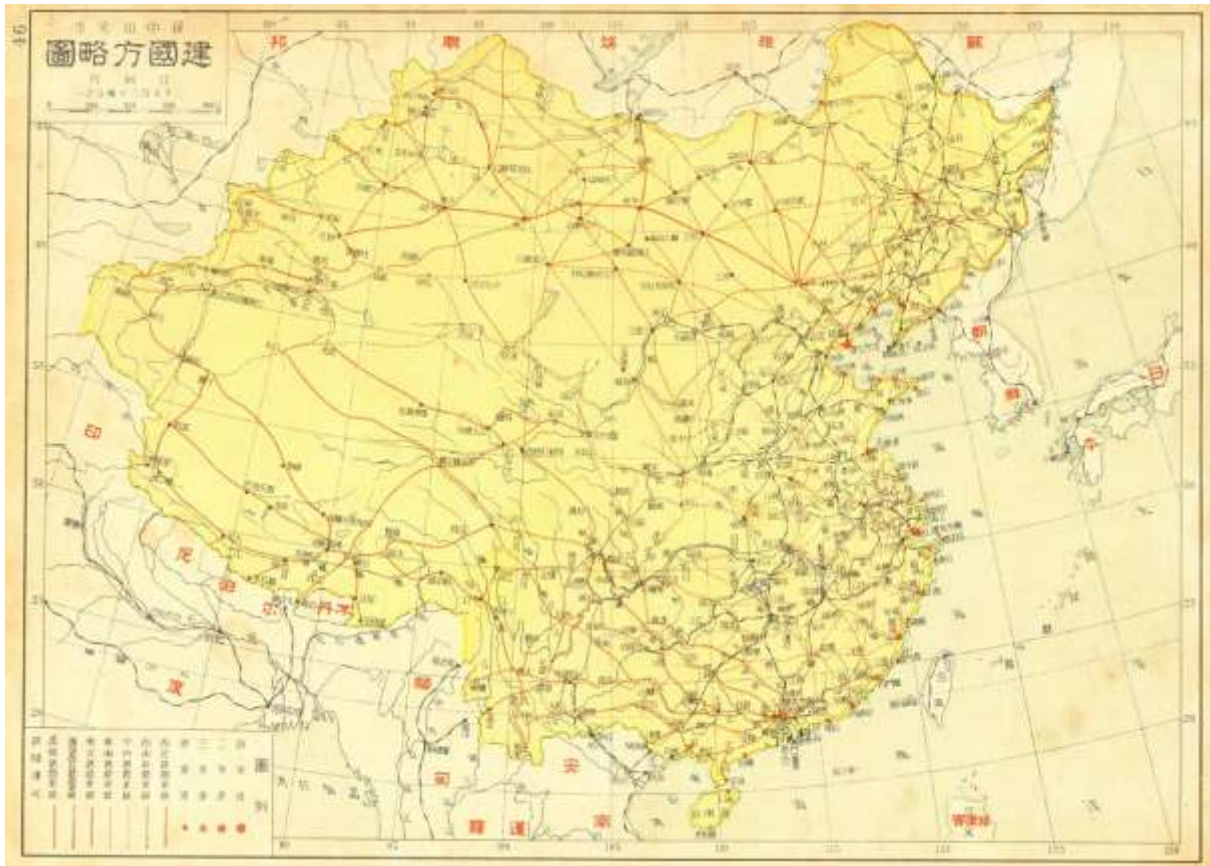
圖 2. 孫中山著書《建國方略》中「實業計畫」示意圖，其中包含鐵路計畫